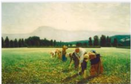
PINÓS I PALÀ, Joan Paisatge amb grup de camperols

Joan Llimona, influent artista català del S.XIX, juntament amb el seu germà Josep, va fundar el Cercle Artístic de Sant Lluç el 1893. La seva obra destaca per transmetre valors i compromís social. En una pintura que captura l'últim sol sobre una masia catalana, Llimona retrata el treball i esforç de les dones rurals rentant llençols en un entorn idíl·lic amb detalls d'una escena quotidiana.