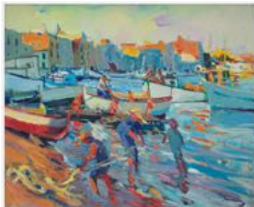
SANVISENS I MARFULL, Ramon Pescadors a la platja, Cambrils

Ramón Sanvisens, pintor català, captura l'essència de Cambrils l'estiu de 1975 amb pescadors desenredant les xarxes a la platja. Les últimes hores de sol destaquen gràcies al color taronja i el dinamisme i la llum de la peça creen una sensació d'harmonia entre colors càlids i freds. L'obra, amb pinzellades espontànies reflecteix la maduresa de Sanvisens, evolucionant cap a un fauvisme "meditat" amb intensitat cromàtica i una visió sincera, vital i optimista de la realitat.