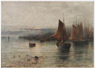
BAUCK, Jeanna Maria Charlotta Marina amb vaixells

En aquesta obra, Bauck, amb una forta tendència impressionista, capta la llum dels darrers raigs de sol que posen fi a l'esgotadora jornada de treball dels mariners, que pleguen les xarxes i tornen a casa a descansar. La verticalitat dels pals dels vaixells fa que penguin com a notes musicals en un pentagrama d'onades suaus i horitzontals.