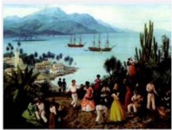
ALAUX, Gustave El ball improvisat

Alaux capta una animada escena de ball en un paisatge tropical, mostrant un grup de persones de diverses races i rangs socials interactuant i ballant alegrement sense importar-ne l'origen i l'estatus. L'artista expressa el poder de la dansa com a llenguatge físic que transcendeix les fronteres, unint la gent en un moment de goig.