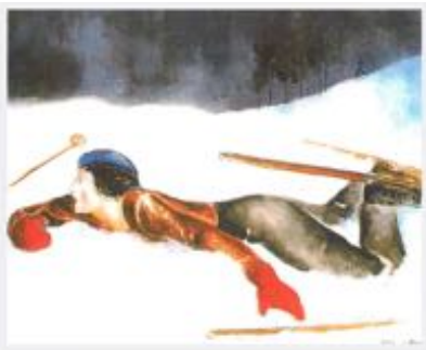
PRUNA I OCERANS, Pere Esports d'hivern IV, Chamonix

Pere Pruna, influït per Picasso, pinta amb línies estilitzades una escena moderna de l'esquí. Inspirat en l'estil moderat de Picasso en el període d'entre guerres, captura la democratització de l'esport després de la Primera Guerra Mundial. La pintura mostra una dona sorpresa per una caiguda enmig de la neu i alhora, Pruna també vol reflectir la popularitat creixent de l'esquí entre les classes mitjanes.