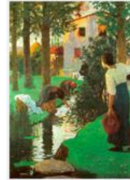
LLIMONA I BRUGUERA, Joan Bugaderes

Joan Llimona, influent artista català del S.XIX, juntament amb el seu germà Josep, va fundar el Cercle Artístic de Sant Lluç el 1893. La seva obra destaca per transmetre valors i compromís social. En una pintura que captura l'últim sol sobre una masia catalana, Llimona retrata el treball i esforç de les dones rurals rentant llençols en un entorn idíl·lic amb detalls d'una escena quotidiana.