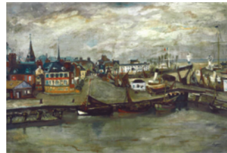
MEIFRÈN I ROIG, Eliseu Velers

A finals dels anys vint, Celso Lagar explora els paisatges d'Honfleur, al nord de França, allunyant-se de l'avantguarda espanyola. En aquesta etapa, pinta melancòlics paisatges marítims influït pel mal temps local. Les seves obres mostren un port en espera d'una imminent tempesta, amb una paleta de grisos i marrons que reflecteixen l'atmosfera plujosa. Lagar destaca la manca d'espai i la perspectiva peculiar amb edificis amuntegats i vaixells al moll.