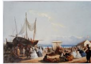
MARTÍ I ALSINA, Ramon Platja de Barcelona

En aquesta obra, Bauck, amb una forta tendència impressionista, capta la llum dels darrers raigs de sol que posen fi a l'esgotadora jornada de treball dels mariners, que pleguen les xarxes i tornen a casa a descansar. La verticalitat dels pals dels vaixells fa que penguin com a notes musicals en un pentagrama d'onades suaus i horitzontals.